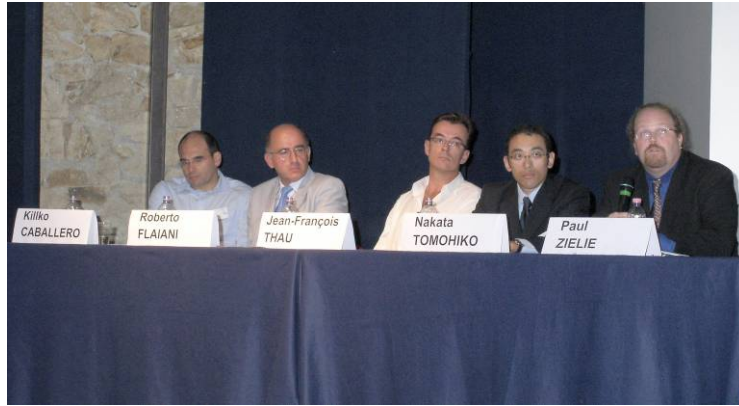
Uma mesa redonda composta de parceiros e revendedores da Aethra discutiu as tendências e questões atuais no espaço da colaboração visual, incluindo desafios que enfrentam os parceiros de canais.

a empresa tem tido muito sucesso em outras áreas, notavelmente na China, e Itália, e está crescendo na França; e mesmo mais interessante é que a Aethra tem tido muito sucesso com os militares dos EUA. Mas seria insensato pensar que introduzindo dois novos endpoints seria a chave do sucesso. A empresa desesperadamente necessita construir uma equipe norte-americana se tiver que ter qualquer chance de crescimento, fazer funcionar sua parceria com a RADVISION (uma tarefa temerosa, para dizer o mínimo), e dedicar alguns esforços reais atrás das promessas afirmadas de uma nova estratégia, novos produtos, nova presença, e um novo marketing.