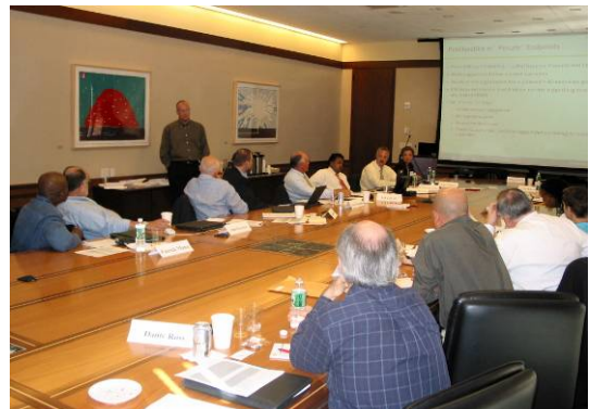
Duas vistas da sala de reunião, em Bear Stearns, onde a Wainhouse Research e 12 multinacionais discutiram as questões de implementação em torno de IP Communications..