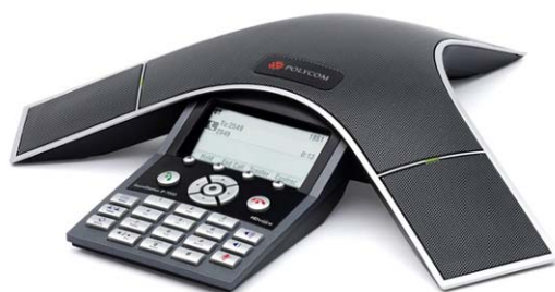
SoundStation IP 7000

今年的晚些时候将可能实现与 HDX 高清可视通信系统的无缝集成。该设备可作为软电话终端与 PC 配合使用，当不存在无线网络连接的时候，该设备还可以与移动电话配合使用。我们已经提到过这款会议电话在没有低音装置的情况下最低可支持 160Hz 的音频。