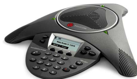
SoundStation IP 6000

SoundStation IP 6000 (以更高的性能和更低廉的价格取代了窄带电话 IP 4000 )可提供 14 kHz 音频，支持可选配的扩展麦克风、PoE，带有可显示呼叫信息并支持多种语言的显示屏。该平台还支持将 Web 内容传送到显示屏用于第三方应用开发。两种会议电话均取得了超过 25 家 Polycom 的 SIP 呼叫控制平台合作伙伴的认证。