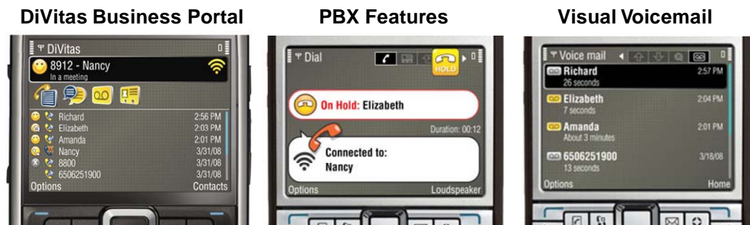
El nuevo cliente del teléfono móvil DiVitas

DiVitas Networks ha anunciado la versión 2.0 de su cliente de aparatos móviles y de su software para el servidor de comunicaciones unificadas móviles. El servidor DiVitas se integra en las aplicaciones existentes, tales como centrales telefónicas, directorios LDAP y plataformas de mensajes. Además, extiende de forma homogénea estas aplicaciones a los usuarios de celulares y de Internet inalámbrica, brindándoles un número único para ser contactados y una casilla de correo única para correos electrónicos y mensajes de voz. El nuevo cliente fue diseñado con una interfaz de usuario gráfica para que los usuarios de teléfonos móviles tengan acceso integral a directorios corporativos, atributos de central telefónica, controles durante la llamada, casilla de voz, presencia, mensajes instantáneos, etc. El nuevo cliente se ejecuta en los teléfonos de la serie E de Nokia y en los aparatos Windows Mobile y en las redes de segunda, segunda y media y tercera generación. El cliente también provee dos identidades: personal y comercial. Por un lado, esto permite que las empresas controlen las llamadas comerciales de sus empleados y por el otro, las personas sólo tienen que cargar un aparato para hacer llamadas de negocios y personales.