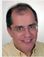
Alex Eleftheriadis Vidyo Point-counterpoint: A new perspective on videoconferencing