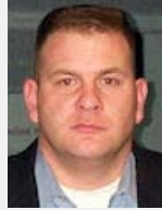
Chris Carr Masergy The Future of Networks for Video