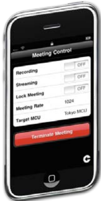
Contrôle de la réunion