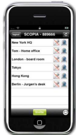
Liste des participant